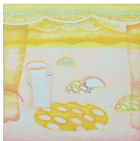
穏やかな天婦羅の郷。 915×910mm / 2015 / 水性木版