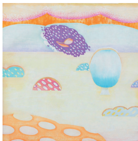
16年前の芽吹き。 915×910mm / 2015 / 水性木版

記憶や感情といった、明確な形がないものの「移ろい」をテーマに制作を行っています。人が抱く感情や記憶といったものは刹那的でゆらぎのあるものです。以前抱いてた感情を再び正確に思い出すことは難しく、形を変えてもなお残っていくものもあれば、跡形もなく消えていくものもあります。同じものを同じように見ているようでも、そこから感じる印象や感覚は日々異なるもので、常に変化していると考えています。