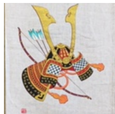
季節のタペストリー