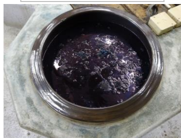
6月 すくも藍の発酵建て