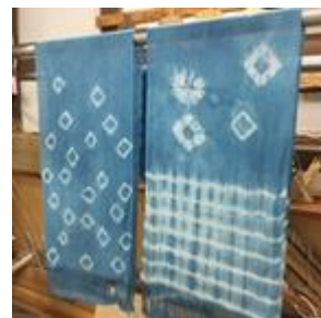
8月 藍の生葉で空色ストール