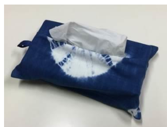
年中開催 藍染め基本体験