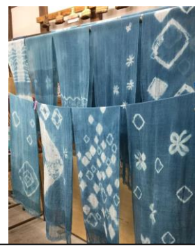
8月 藍の生葉で空色ストール