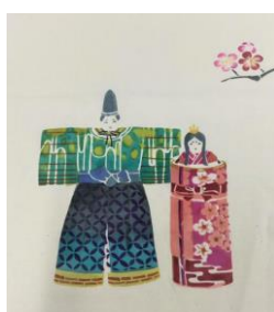
1・2・3月随時 ひな祭りタペストリー