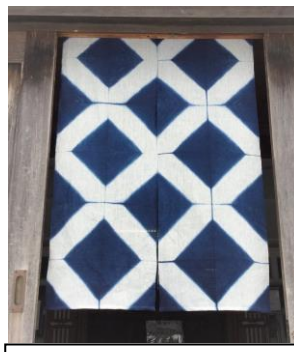
7月 藍染で麻の暖簾