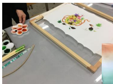
4月 加賀友禅染 (友禅絵付け筆)