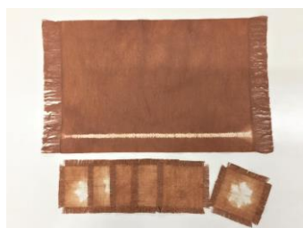
9月 身近な草木で テーブルウェア