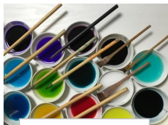
4月・5月 加賀友禅 染額 (友禅絵付け筆)