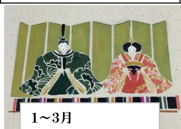
1～3月 ひな祭りタペストリー