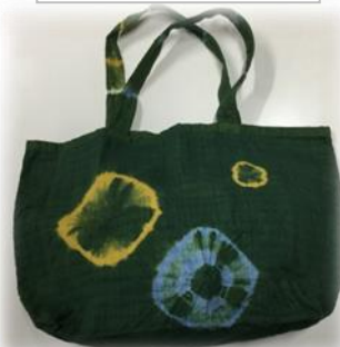
7月 藍と草木で多色染めトートバッグ