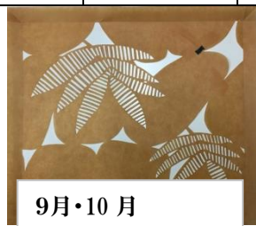
9月・10月 連続模様の作り方