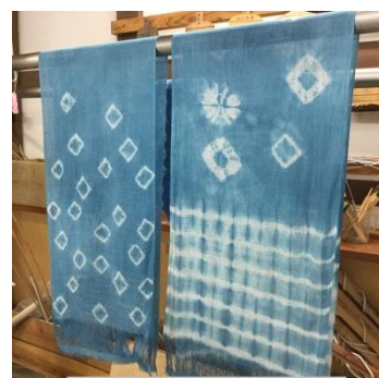
8月 生葉で空色ストール染め