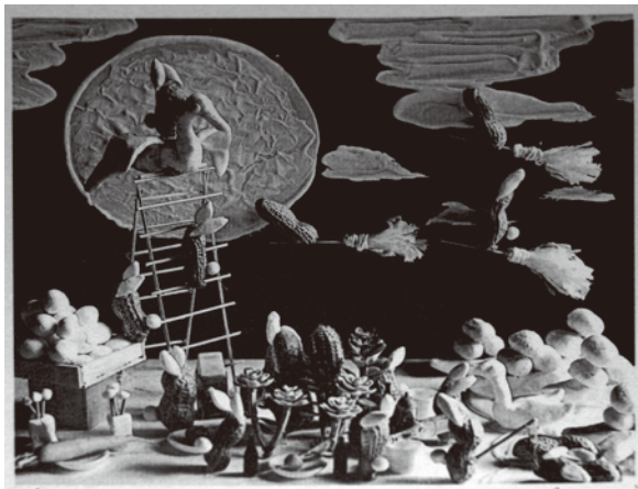
moon watching / リトグラフ / 21×29cm / 2016

平成28年度の招聘作家として滞任制作中のリトグラフ作家、安齋歩見(あんざい あゆみ)さんの作品と制作の様子を公開いたします。最初に模型(マケット)で世界を作り、それを写真に撮影して製版し、最後にプリントして版画作品を制作するというユニークな創作のプロセスとピーナッツの織りなす独特な世界を是非ご覧下さい。