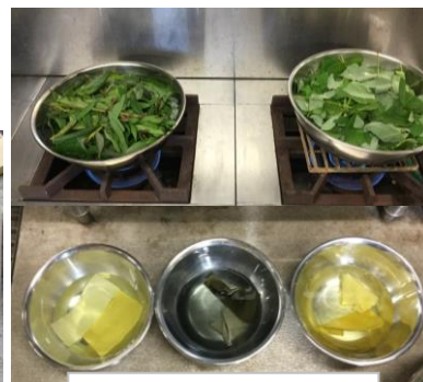
8月 身近な草木で黄色染