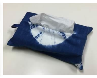
年中開催 藍染め体験