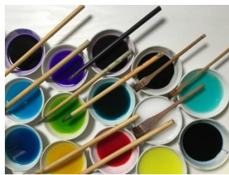
4月 加賀友禅染 (友禅絵付け筆)