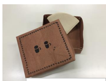
11月12月 柿渋染めのハコ