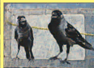
イレイン・ハノウエル Elaine Hanowell