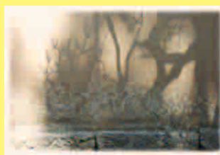
谷山文衛 Fumie Taniyama