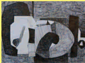
グレン・セブラッシュ Glen Cebulash