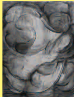
岩本宇司 Takashi Iwamoto