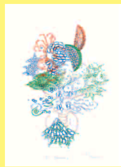
カワベヒロミ Hiromi Kawabe