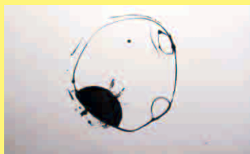
山本 廣 Hiroshi Yamamoto