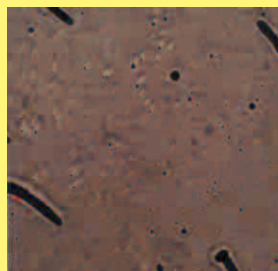
友蔵良一 Ryoichi Tomoyosi