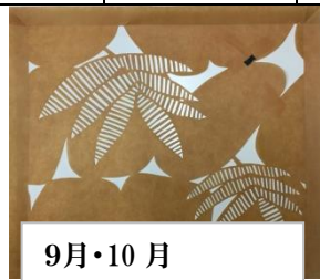
9月・10月 連続模様の作り方