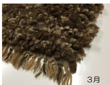
ノッティング技法で織る チェアーマット