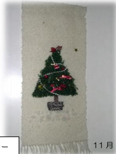
クリスマスツリーのタペストリー