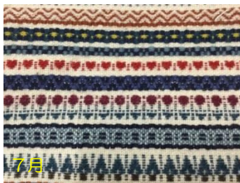
編み込み技法で織るポーチ