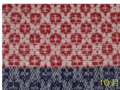
小花の幾何学模様を織る ウールストール